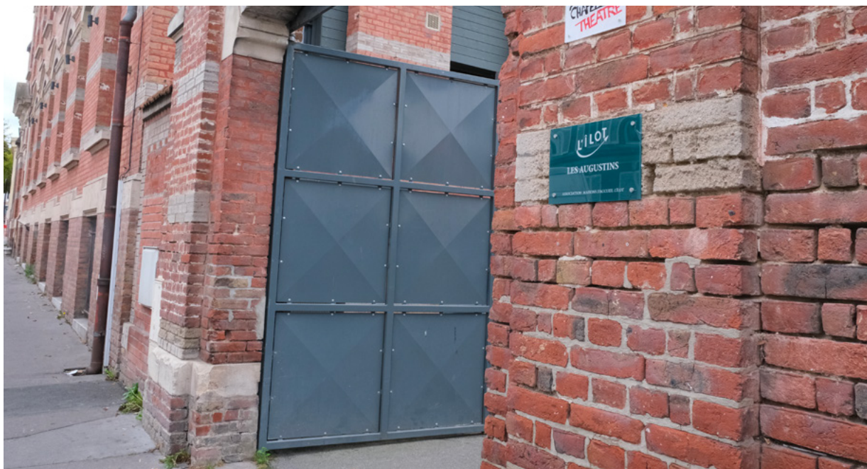
La Chapelle-Théâtre jouxte les locaux du foyer des Augustins. Depuis 2016, elle est mise à disposition gratuitement pour des compagnies artistiques picardes. En échange, celles-ci y animent des ateliers à destination des résidents.

La troupe amiénoise cherchait un lieu pour répéter et construire ses spectacles. Le directeur y a vu un moyen de « faire entrer de la vie » dans le foyer. Ils signent alors une convention, avec mise à disposition gratuite de la chapelle.