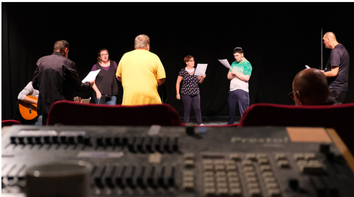
Les traces du passé religieux de la chapelle ont en partie été effacées. Une console son et lumière a remplacé l'autel. Le lieu est cosy et feutré.